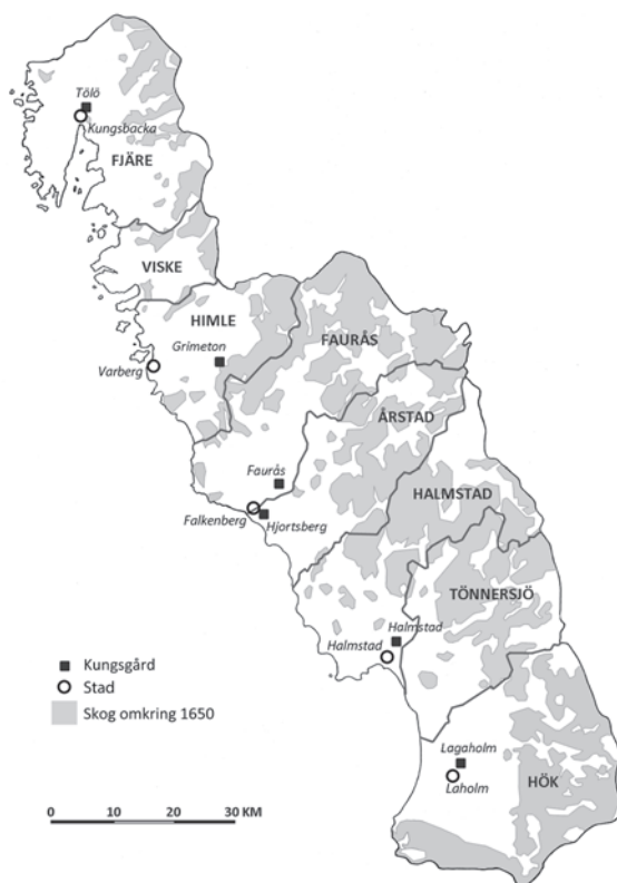
Figur 2. Häraeder, medeltida kungsgårdar och städer i Halland. Ur Nilsson 2016:192, fig.1.

I denna källa omtalas Lagaholm på två ställen: i Kungalevslistan och i Hallandslistan. Att orten nämns i Kungalevslistan visar att den vid denna tid ingick i den kungliga domänen, men säger egentligen inte så mycket mer. I Hallandslistan, där alla intäkter från skatter och kungliga gods från Halland förtecknas, finns dock en något mer innehållsrik beskrivning. Texten kan (i fri översättning från latinet) utläsas: "Själva gården Lagaholm räntar av torget, landborna, skatten, kvarnen och fisket 15 mark silver" (KVJ:36f). Två aspekter av detta är särskilt intressanta. Den första är att Lagaholm var en lönsam gård. Det var den kungsgård i Halland som renderade näst mest pengar till kronan. Endast Tölö gav mer (20 mark silver), medan övriga kungsgårdar inbringade mellan 8 och 10 mark silver. Lagaholm var också den kungsgård som hade flest separata verksamheter knutna till sig. Flera av kungsgårdarna i Hallandslistan hade inkomster från landsbogods (Grimeton, Faurås och Hjortsberg), Faurås hade utöver detta även avkastning från kvarndrift och Hjortsberg från fiskeri. Lagaholm utmärker sig dock genom att ha intäkter från alla dessa inkomstkällor och dessutom från "torg" och "skatt". Detta har vanligen tolkats som att