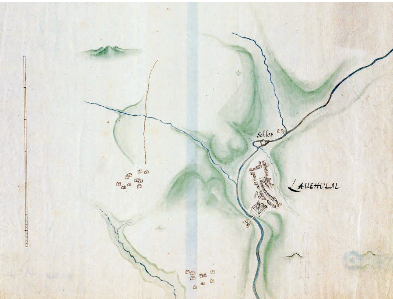
Figur 7. Gottfred Hoffmans karta över Laholm 1625. Danska kungliga biblioteket 1113, 114,11-0-1/1625.

Min egen uppfattning är att staden haft en obestridlig koppling till kungsgården, men att handelsverksamhetens omlokalisering inte enbart varit maktpolitiskt motiverad. Jag vill i stället se förändrade kommunikationsmönster som en grundläggande orsak, närmare bestämt en förskjutning i tyngdpunkten från sjöväga förbindelser till transporter landvägen. Fyndmaterial och andra lämningar tyder på att det på udden mitt emot Laholms nuvarande småbåtshamn och upp mot Kung Ises hög (fornlämning Laholm 17:1) funnits en vendel- och vikingatida