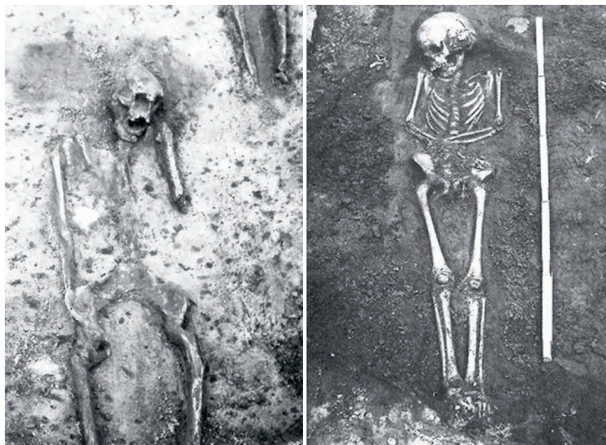
Figur 5. Gravläggningar från begravningsplatsen vid Lagaholm. Ur Anberg 1994:32.

I samband med kraftverksutbyggnaden stötte man i början på 1930-talet på åtskilliga skelett på den västra delen av Skansholmen. De låg i öst-västlig riktning och allt tydde på att det rörde sig om en tidigare okänd kristen gravplats. Huvuddelen av dokumentationen från dessa tidiga utgrävningar har dessvärre gått förlorad, men platsen har även senare, 1979 och i början av 1990-talet, blivit