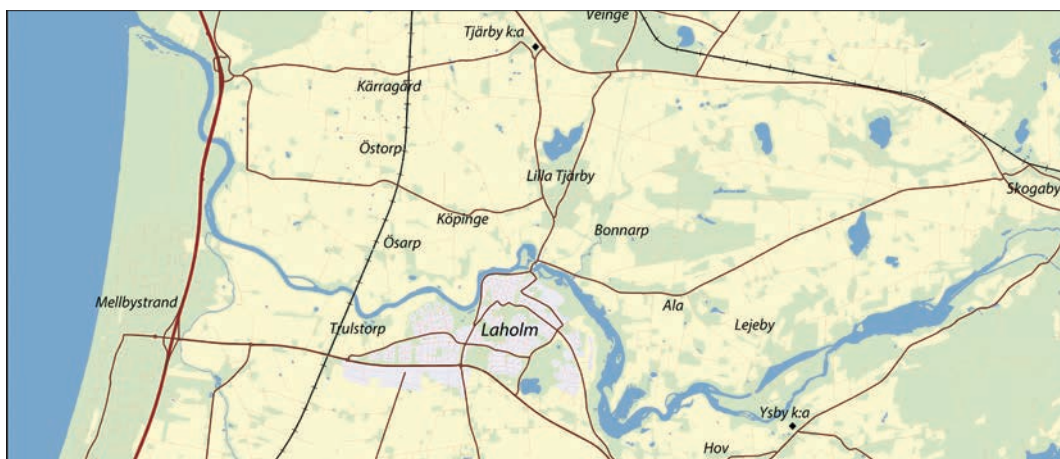
Figur 1. Översiktsbild Laholm.

Strax norr om Laholm, på Skansholmen i Lagan, ligger Lagaholms slottsruin. Numera löper landsvägen mot Halmstad rakt över fornlämningen, och det man idag kanske främst lägger märke till är 1930-talets vattenkraftverk med den stor-slagna turbinhallen, ett nationalromantiskt industripalats i vacker natursten. En närmare blick ger emellertid vid handen att Lagaholm också inrymmer välbevarade ruiner av Christian IV:s lilla femkantiga bastionsbefästning som syftade till att skydda Lagans nedre lopp. Anläggningen påbörjades 1609 men blev snabbt omodern till följd av krigskonstens snabba utveckling, och revs redan 1675. Under lämningarna av renässansbefästningen döljer sig emellertid även spåren av en ännu äldre anläggning, den medeltida borgen Lagaholm. Det äldsta be-lägget för namnet Lagaholm är dock ytterligare några decennier äldre och kommer från kung Valdemars jordebok från omkring 1230.