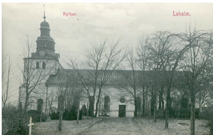
Figur 8. S:t Clemens kyrka i Laholm.

som en stad som anlades på Lagans södra sida, och redan namnet vittnar om ett nära samband mellan kungsgård och stad. Strävan att ta kontroll över den väletablerade handelsverksamheten i Köpinge bör ha varit en viktig orsak till att den danska kungamakten från början siktat in sig på Laholmstrakten. Under högmedeltiden blev emellertid den nord-sydliga landsvägen allt viktigare, och det grundläggande problemet med Köpinge var att orten låg på fel sida ån. Att Laholm anläggs på den höglänta platån på Lagans södra sida bör således ha att göra med kustvägens sträckning, där den viktiga vägövergången över Lagan behärskades av kungsgården, senare borgen, Lagaholm. Utbyggnaden av kyrkan och tillkomsten av ett S:t Gertrudskapell vittnar om en viss urban tillväxt under senmedeltiden, men genom sitt läge har Laholm aldrig haft förutsättningar att bli någon mer betydande exporthamn, något som måste ha verkat hämmande på stadsutvecklingen.